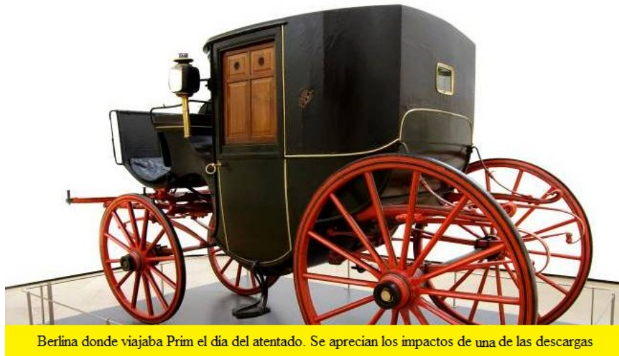
Berlina del General Prim.

Gobernación - y Herreros de Tejada 63 para comentar detalles de última hora.