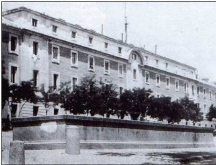
Cuartel de San Gil

Desde finales de mayo de 1865 parecía madura la conspiración que debía hacer triunfar los principios liberales. El comité central de acción del partido progresista era el encargado de combinar la operación prevista contra el Gobierno moderado, que aún encabezaba Narváez. A las órdenes de Moriones 24 , trasladado pocos días después a Valencia y sustituido por Pierrard 25 , eran bastantes las unidades militares de la guarnición madrileña,