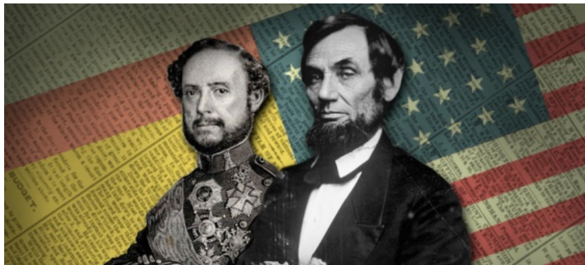
Prim y Lincoln

tes de que éste fuera asesinado 11 . Su estancia en los Estados Unidos, inmersos en la Guerra Civil, le permitió conocer a Prim la capacidad militar y la organización política de la Unión. Quedo impresionado profundamente por el potencial norteamericano. Jamás se le volvería a ocurrir ninguna bravata frente a los “yanquis” y sí tendría, desde entonces, la sospecha de que ellos eran la gran amenaza para el futuro de las Antillas españolas. El héroe de la guerra de África, sin duda alguna, pudo reunirse con Lincoln porque los colaboradores del presidente le informaron de sus hazañas militares y porque siempre se había manifestado a favor de la causa del Norte. Pero Lincoln desconocía que Prim en su época de Gobernador en Puerto Rico había promulgado un “Código Negro” contra los indígenas de la isla que pasaban por una situación semiesclavista.