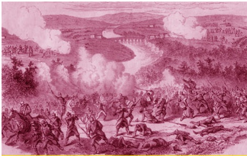
La Batalla de Alcolea

zas andaluzas, había formado un ejército importante. Desoyendo las insinuaciones del General Serrano, que proponía un armisticio, Novaliches, junto con los Generales Caballero de Rodas 38 , Izquierdo 39 y Rey 40 , pasaron el puente de Despeñaperros el 21 de septiembre. La batalla se dio el 24 del mismo mes en el puente de Alcolea, sobre el Guadalquivir, cerca de Córdoba, y el ejército isabelino fue rechazado. Novaliches, herido, entregó el mando al General García de Paredes, que no pudo contener la desbandada de las tropas, las cuales se unieron a las de Serrano para continuar la marcha hacia Madrid.