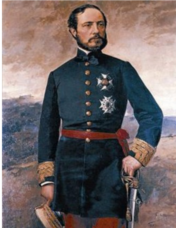
El General Prim